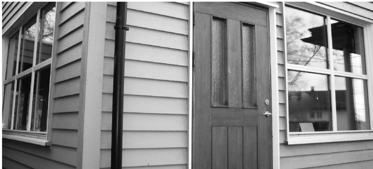
Angstringen Oslos lokaler i Morellvei.