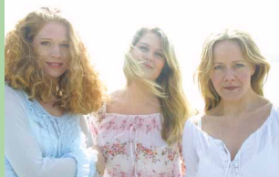
Opera i tiden