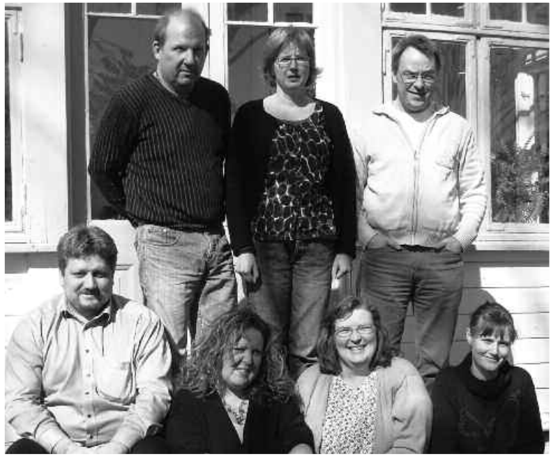
Deltakere på Østfoldsamling

Selvhjelpsfrivillighet dreier seg om å gi stafettpinnen videre. Men de «gamle traverne» i Angstringen må spørre seg selv: Gjør jeg dette for at ting ikke skal ramle sammen eller får jeg fortsatt utbytte av dette? Hvordan kan en inkludere de nye som kommer? Mulighetene til å gå videre, må trekkes frem av igangsettere. En må også