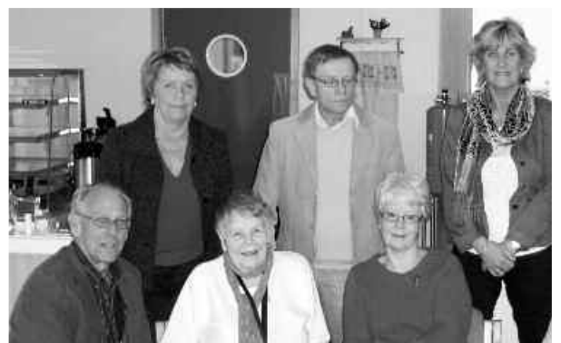
Arrangørene og foredragsholdere på Bergosenteret

Angstringen Hadeland har et tett samarbeid med Frivillighetsentralen på Gran. Et viktig mål med dagseminaret var å gi nye